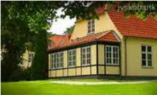
Hotel Gl. Skovridergaard