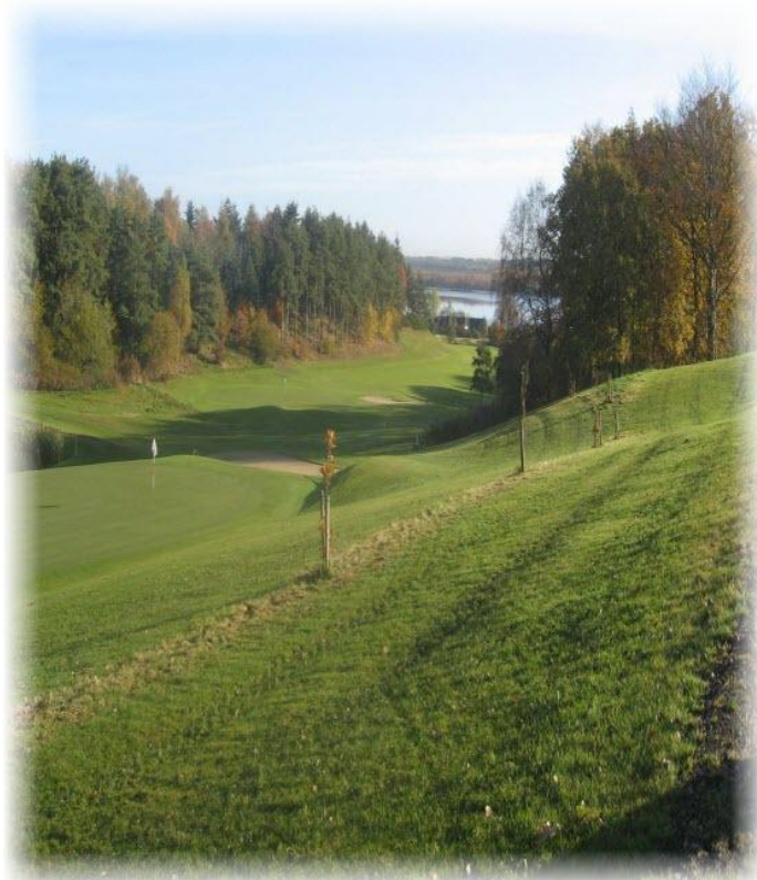
Tange Sø Golfklub